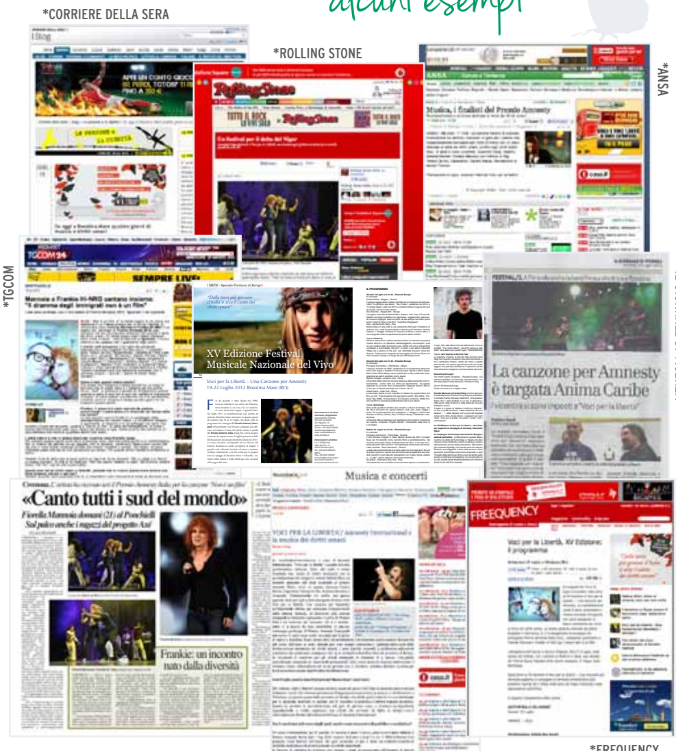
*CORRIERE DELLA SERA