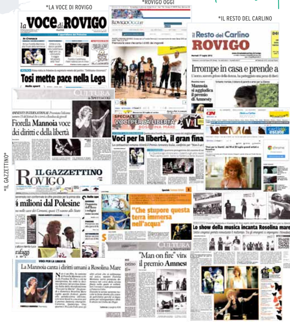
*LA VOCE DI ROVIGO