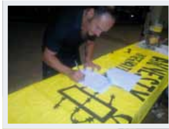
Fiorella Mannoia mentre visita la mostra