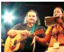
Modena City Ramblers 2005