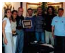
Daniele Silvestri 2003

Nel 2003 è stato istituito il PREMIO AMNESTY ITALIA (P.A.I.) che ha permesso di portare il festival alla ribalta delle cronache italiane e di diffondere ancora di più le tematiche dei diritti umani. Il P.A.I. nasce dalla volontà della Sezione Italiana di Amnesty International e del concorso "Voci per la Libertà" con lo scopo di coinvolgere artisti già affermati a livello nazionale che abbiano pubblicato una canzone il cui testo possa contribuire alla sensibilizzazione sulla difesa dei Diritti Umani.