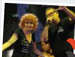
*PREMIO AMNESTY ITALIA

"Ho sempre appoggiato le cause promosse da Amnesty International e ricevere questo premio mi onora" - ha dichiarato Fiorella Mannoia. "Quando ho contattato Frankie per questo mio ultimo progetto intitolato 'Sud' gli ho fatto una richiesta ben precisa, volevo toccasse il tema dell'immigrazione, ne parliamo e ci siamo scambiati le nostre idee. Concordavamo sul fatto che stiamo vivendo un momento storico molto delicato, in cui una parte del Paese, non tutto per fortuna, si lascia influenzare dal terrorismo delle parole (non meno pericoloso del terrorismo delle armi), di una parte della politica che per meri fini di propaganda elettorale usa gli immigrati, non avendo altri argomenti, per diffondere l'antico germe dell'odio razziale, mettendo in pratica l'antica tattica del 'divide et impera', dimenticando (o meglio, facendo finta di dimenticare) che tutto il benessere dell'occidente poggia sulle spalle di interi paesi del Sud del mondo, Africa in testa, saccheggiati da una politica predatoria della quale tutti i governi sono responsabili".