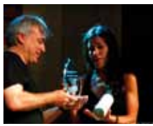
Paola Turci 2006