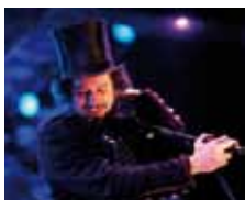
Vinicio Capossela 2009