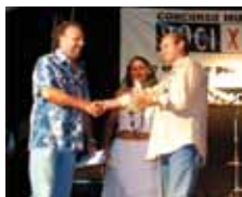
Ivano Fossati 2004