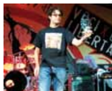
Samuele Bersani 2007