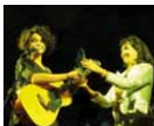
Carmen Consoli 2010