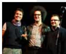
Simone Cristicchi 2011